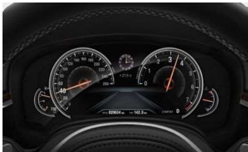
6WB_ Многофункциональный дисплей на приборной панели

Многофункциональный дисплей на приборной панели с технологией Black Panel и диагональю экрана 12,3" обеспечивает эффектное отображение параметров движения автомобиля. Различные режимы и их функции отображаются на приборной панели в разном цвете и графике для каждого из трех режимов: COMFORT, ECO PRO и SPORT.