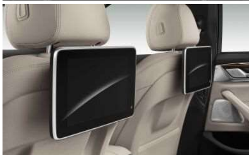
6FH_ Развлекательная система для задних пассажиров Professional

Развлекательная система для задних пассажиров Professional включает в себя проигрыватель Blu-ray и два отдельных цветных дисплея с диагональю 10,2" и регулируемым углом наклона. Для развлекательной системы Professional предусмотрено также дистанционное управление. Кроме того, она включает в себя разъемы для подключения MP3-плееров, игровых консолей и наушников (может использоваться вместе с беспроводными наушниками).