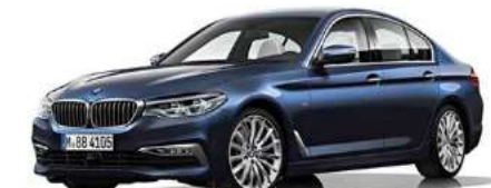
7S2_Пакет Luxury Line

Элементы дизайна в решетке радиатора, обтекателе бампера и жабрах. Хромированные выпускные патрубки Обивка сидений кожа Dakota 18" дюймовые легкосплавные диски "type 632" Пороги с подсветкой