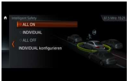
5AT_Ассистент вождения Plus

Ассистент вождения Plus обеспечивает высокий уровень комфорта и безопасности езды в полуавтоматическом режиме в условиях монотонного движения и опасных ситуациях. К ним могут относиться пробки или медленное движение в плотном транспортном потоке, а также долгие поездки по городу, загородным дорогам или скоростным шоссе. Одновременно система следит за приближением перекрестков и отслеживает полосы движения. Система вмешивается в управление, если водитель не предпринимает никаких действий