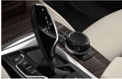
4U1_Керамическая отделка органов управления

Эксклюзивная керамическая отделка органов управления, включая рычаг коробки передач и ручки управления климат-контролем, а также окантовку контроллера iDrive, придает салону первоклассный и роскошный вид.