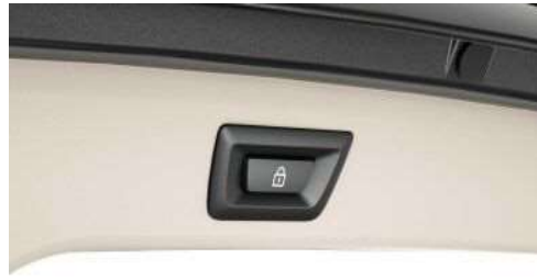
316_Автоматический привод крышки багажника

Автоматический привод позволяет с помощью электропривода открывать и закрывать крышку багажника - для этого достаточно одного нажатия кнопки в салоне или на ключе. Крышку багажного отделения можно открыть и обычным образом при помощи наружной ручки, а закрыть нажатием кнопки на двери.