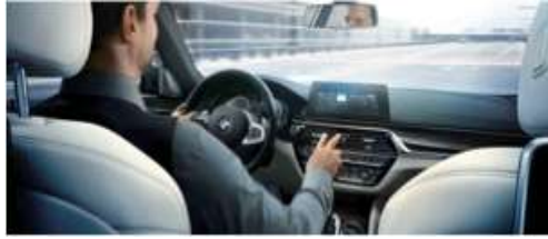
6U8_ Управление жестами

Система управления жестами BMW позволяет управлять определенными функциями автомобиля легким движением руки. Так, например, система распознает жесты "смахнуть" или "указать" для приема или отклонения входящего вызова, или вращательное движение указательного пальца для регулировки громкости.