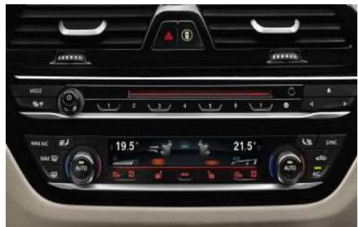
4NB_Автоматический контроль климата, 4-зонный

Автоматический 4-зонный климат-контроль предлагается с оборудованием, входящим в состав 2-зонного климат-контроля с расширенными функциями, а также включает два воздушных дефлектора в центральных стойках. Кроме того, пассажиры задних сидений могут индивидуально регулировать температуру с помощью панели управления с дисплеем.