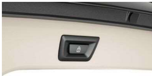
316_Автоматический привод крышки багажника

Автоматический привод позволяет с помощью электропривода открывать и закрывать крышку багажника - для этого достаточно одного нажатия кнопки в салоне или на ключе. Крышку багажного отделения можно открыть и обычным образом при помощи наружной ручки, а закрыть нажатием кнопки на двери.