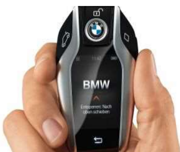
3DS_Ключ BMW Display Key

Инновационный интерактивный ключ BMW Display Key предоставит Вам информацию о состоянии Вашего автомобиля и позволит управлять определенными функциями с помощью встроенного сенсорного дисплея. Так, с помощью ключа можно, например, управлять включением автономной системы отопления.