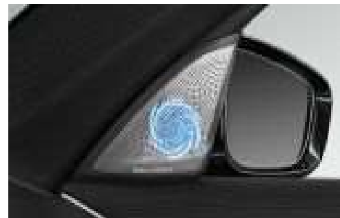
6F1_Аудиосистема Bowers & Wilkins Diamond surround sound

Аудиосистема Bowers & Wilkins Diamond Surround Sound с двумя алмазным высокочастотными динамиками отличается выходной мощностью 1400 Вт и выдающимся студийным качеством звука для каждого места в автомобиле. 16 динамиков с тщательно подобранным размещением гарантируют необыкновенные впечатления. Динамики подсвечиваются, визуально подчеркивая выдающееся качество звучания.