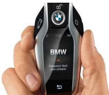
3DS_Ключ BMW Display Key

Инновационный интерактивный ключ BMW Display Key предоставит Вам информацию о состоянии Вашего автомобиля и позволит управлять определенными функциями с помощью встроенного сенсорного дисплея. Так, с помощью ключа можно, например, управлять включением автономной системы отопления.