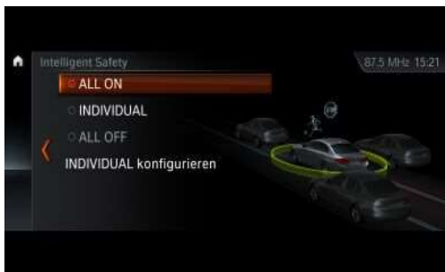
5AT_Ассистент вождения Plus

Ассистент вождения Plus обеспечивает высокий уровень комфорта и безопасности езды в полуавтоматическом режиме в условиях монотонного движения и опасных ситуациях. К ним могут относиться пробки или медленное движение в плотном транспортном потоке, а также долгие поездки по городу, загородным дорогам или скоростным шоссе. Одновременно система следит за приближением перекрестков и отслеживает полосы движения. Система вмешивается в управление, если водитель не предпринимает никаких действий