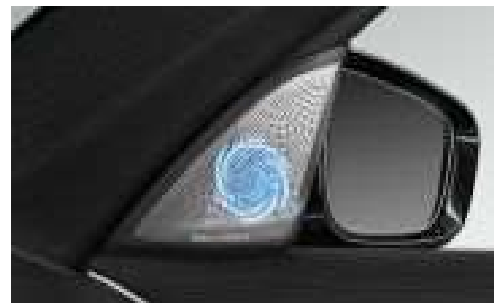
6F1_ Аудиосистема Bowers & Wilkins Diamond surround sound

Аудиосистема Bowers & Wilkins Diamond Surround Sound с двумя алмазными высокочастотными динамиками отличается выходной мощностью 1400 Вт и выдающимся студийным качеством звука для каждого места в автомобиле. 16 динамиков с тщательно подобранным размещением гарантируют необыкновенные впечатления. Динамики подсвечиваются, визуально подчеркивая выдающееся качество звучания.