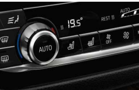
Активная вентиляция передних сидений

В теплую погоду функция вентиляции передних сидений обеспечивает прохладную и приятную температуру, в результате чего поездки становятся более комфортными. От воздуховодов, расположенных близко к поверхности подушки и спинки, через перфорированную обивку сиденья подается воздух. Интенсивность подачи воздуха можно регулировать.