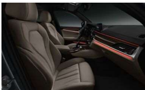
4UR_ Окружающий свет

Пакет освещения позволяет создать в салоне особую, приятную атмосферу, включая комфортную подсветку и приветственный свет. Предлагается 11 предустановленных вариантов подсветки салона в шести различных цветах с контурной и комфортной подсветкой инструментальной панели, декоративных планок в дверях и центральной консоли.