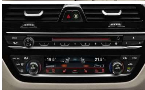
4NB_Автоматический контроль климата, 4-зонный

Автоматический 4-зонный климат-контроль предлагается с оборудованием, входящим в состав 2-зонного климат-контроля с расширенными функциями, а также включает два воздушных дефлектора в центральных стойках. Кроме того, пассажиры задних сидений могут индивидуально регулировать температуру с помощью панели управления с дисплеем.