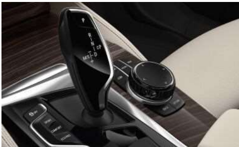
4U1_Керамическая отделка органов управления

Эксклюзивная керамическая отделка органов управления, включая рычаг коробки передач и ручки управления климат-контролем, а также окантовку контроллера iDrive, придает салону первоклассный и роскошный вид.