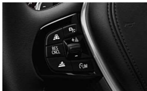
5DF_Активный круиз-контроль с функцией Stop&Go

Активный круиз-контроль с функцией Stop&Go, индикатором ограничения скорости, индикатором запрета обгона, системой предупреждения о столкновении, с функцией торможения реагирует на неподвижные автомобили, поддерживает заданное расстояние до автомобилей, движущихся впереди, и регулирует скорость вплоть до полной остановки, возобновляя движение автомобиля в момент, когда это позволяет делать дорожная обстановка.