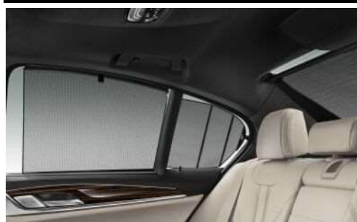
416_Механические солнцезащитные шторки

Солнцезащитная шторка с электроприводом для заднего окна наряду с механическими шторками задних боковых окон позволяют защититься от прямого солнечного света и предотвращают быстрый нагрев салона. При этом в задней части салона создается приватная обстановка.