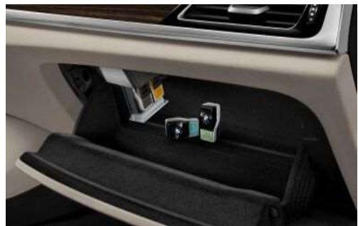
4NM_Пакет "Окружающий воздух"

Пакет Ambient Air включает в себя функцию ароматизации и ионизации воздуха. Предлагаются восемь разных ароматов, специально подобранных для этого автомобиля.