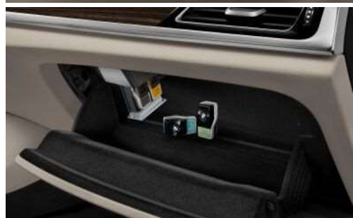
4NM_Пакет "Окружающий воздух"

Пакет Ambient Air включает в себя функцию ароматизации и ионизации воздуха. Предлагаются восемь разных ароматов, специально подобранных для этого автомобиля.