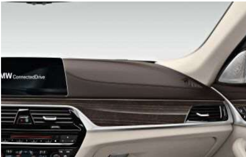
4AW_Обивка приборной панели Sensatec

Обивка приборной панели Sensatec создает эксклюзивную атмосферу в салоне. Искусственная кожа наносится непосредственно на полужесткую пену, в результате чего поверхность становится очень мягкой.