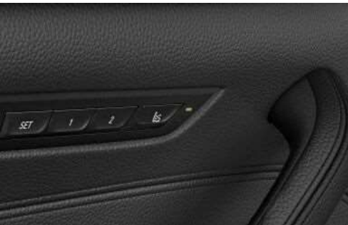
Сиденья с функцией массажа для водителя

Сиденья с функцией массажа для водителя и пассажиров улучшают физическое состояние, стимулируя или расслабляя определенные группы мышц. Предлагается 8 программ массажа для различных частей тела.