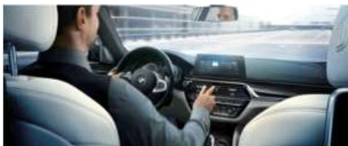
6U8_ Управление жестами

Система управления жестами BMW позволяет управлять определенными функциями автомобиля легким движением руки. Так, например, система распознает жесты "смахнуть" или "указать" для приема или отклонения входящего вызова, или вращательное движение указательного пальца для регулировки громкости.