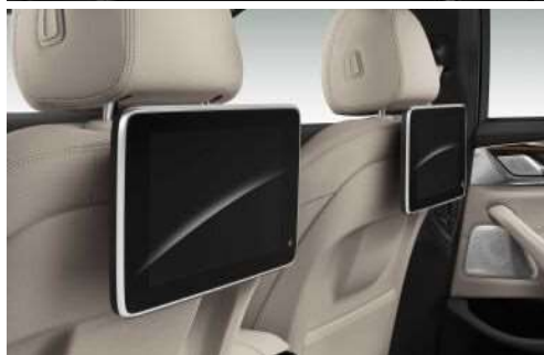
6FH_Развлекательная система для задних пассажиров Professional

Развлекательная система для задних пассажиров Professional включает в себя проигрыватель Blu-ray и два отдельных цветных дисплея с диагональю 10,2" и регулируемым углом наклона. Для развлекательной системы Professional предусмотрено также дистанционное управление. Кроме того, она включает в себя разъемы для подключения MP3-плееров, игровых консолей и наушников (может использоваться вместе с беспроводными наушниками).