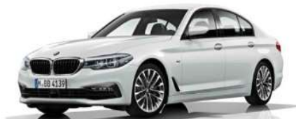
7AC_Пакет Sport Line

Элементы дизайна в решетке радиатора, обтекателе бампера и жабрах. Выпускные патрубки в глянцевом черном Обивка сидений кожа Dakota 18" дюймовые легкосплавные диски "type 634" Пороги с подсветкой