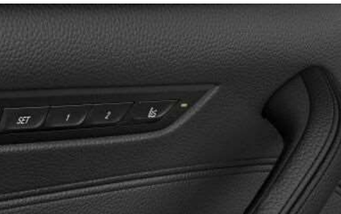
Сиденья с функцией массажа для водителя

Сиденья с функцией массажа для водителя и пассажиров улучшают физическое состояние, стимулируя или расслабляя определенные группы мышц. Предлагается 8 программ массажа для различных частей тела.