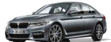
337_Пакет M Sport

Обвес M Sport Подвеска M Sport с заниженным клиренсом (доступно и для xDrive) Тормоза M Sport Выпускные патрубки в версии 540i M пороги с подсветкой