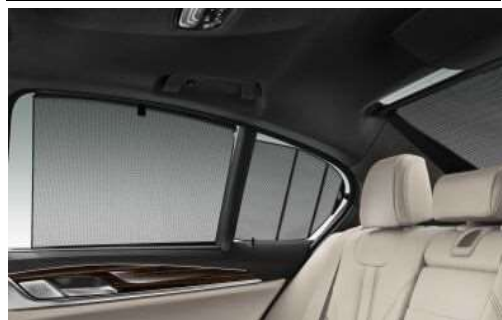
416_Механические солнцезащитные шторки

Солнцезащитная шторка с электроприводом для заднего окна наряду с механическими шторками задних боковых окон позволяют защититься от прямого солнечного света и предотвращают быстрый нагрев салона. При этом в задней части салона создается приватная обстановка.