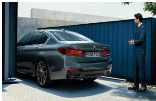
5DV_Функция парковки с дистанционным управлением

Функция парковки с дистанционным управлением позволяет водителю выйти из автомобиля в удобном месте, а затем дать команду припарковаться автомобилю на узкое парковочное место или в гараж. Водитель активирует функцию парковки, находясь вне автомобиля, с помощью интерактивного ключа BMW Display Key.