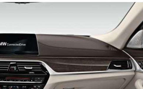
4AW_Обивка приборной панели Sensatec

Обивка приборной панели Sensatec создает эксклюзивную атмосферу в салоне. Искусственная кожа наносится непосредственно на полужесткую пену, в результате чего поверхность становится очень мягкой.