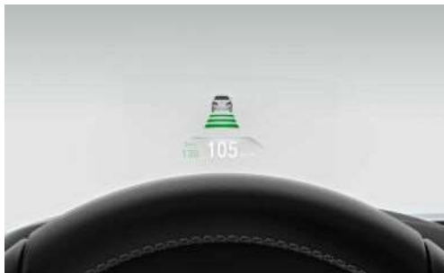
610_ Проекционный дисплей

Полноцветный проекционный дисплей BMW отображает важную информацию непосредственно в поле зрения водителя, что позволяет полностью сконцентрироваться на вождении. Здесь, в частности, отображаются текущая скорость, указания навигационной системы, ограничения скорости, включая сообщение о запрете обгона, списки телефонов и данных развлекательной системы.