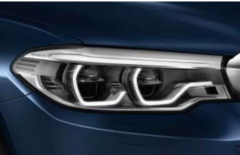
552_Адаптивные светодиодные фары

Объединяют в себе неослепляющую систему управления дальним светом фар BMW Selective Beam, систему статического освещения поворотов и адаптивные фары головного света. Яркий свет фар, близкий к дневному свету, обеспечивает оптимальное, равномерное освещение дороги, тем самым снижая утомляемость водителя. Световой поток автоматически распределяется в зависимости от скорости движения и угла поворота рулевого колеса.