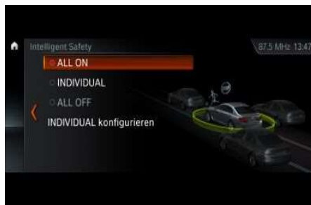
5AT_Ассистент вождения Plus

Система Ассистент вождения Plus включает в себя системы слежения за разметкой, предупреждения о столкновении и активный круиз-контроль с функцией Stop&Go, а также систему помощи при движении в пробках. Тем самым Driving Assistant Plus повышает безопасность и комфорт при движении на автобанах. Для использования системы Driving Assistant Plus и системы помощи при движении в пробках автомобиль должен быть оснащен АКПП и навигационной системой Professional.