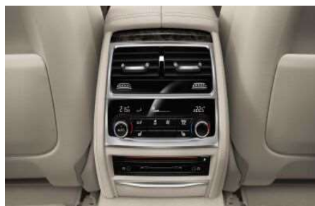
4NB_Автоматический климат-контроль, 4 зоны

Четырёхзонный климат-контроль обеспечивает возможность создания индивидуального микроклимата для водителя, переднего пассажира и пассажиров на заднем сиденье. Передний дисплей управления микроклиматом становится полностью сенсорным.