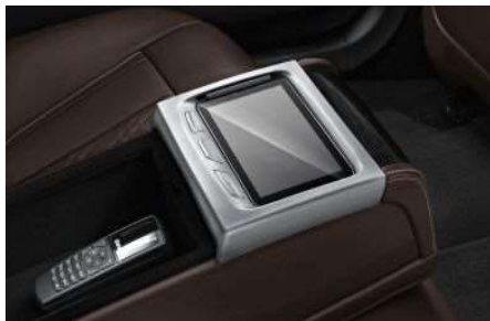
6U9_Сенсорный планшет BMW Touch Command

Сенсорный планшет BMW Touch Command с диагональю 7 дюймов встроен в подлокотник в задней части салона, объединен в единую сеть с системами автомобиля и предоставляет разнообразные возможности настройки и управления. В зависимости от установленного оборудования в автомобиле с планшета можно регулировать задние сиденья и сиденье переднего пассажира, настраивать климат-контроль, вентиляцию и обогрев задних сидений, а также освещение салона и комфортную подсветку, управлять шторкой панорамной крыши и шторками на окнах. Кроме того, возможно управление функциями паявлекательной системы.