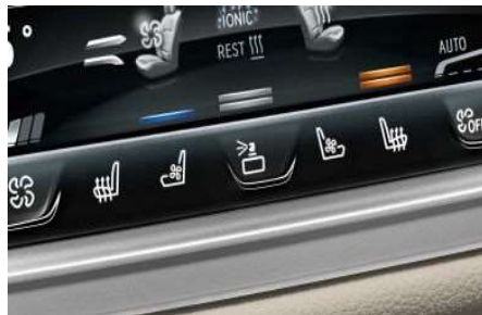
4NM_Пакет "Окружающий воздух"

Пакет Ambient Air обеспечивает чистоту и свежесть воздуха в салоне, специальным образом ароматизируя его. В общей сложности, на выбор предлагаются четыре различных аромата французской парфюмерной марки, из которых два могут попеременно использоваться в автомобиле. Дополнительно воздух в салоне очищается методом ионизации. Управление осуществляется через меню iDrive.