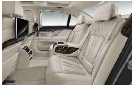
460_Комфортные задние сиденья, электрорегулируемые

Комфортные сиденья в задней части салона имеют разнообразные возможности электрорегулировки, исключительно эргономичны и способствуют отличному самочувствию, особенно в дальних поездках.