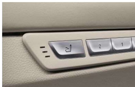
4T6_Сиденья с функцией массажа для задних пассажиров

Массажная функция сидений в задней части салона, повышая тонус мышц и расслабляя их, способствует оптимальному самочувствию пассажиров.