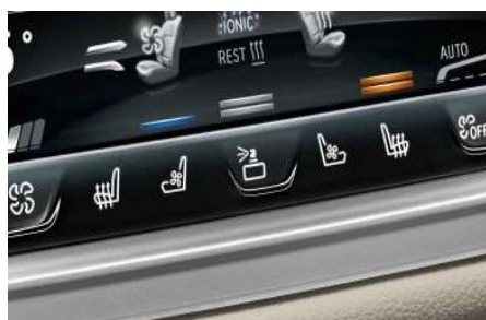
4NM_Пакет "Окружающий воздух"

Пакет Ambient Air обеспечивает чистоту и свежесть воздуха в салоне, специальным образом ароматизируя его. В общей сложности, на выбор предлагаются четыре различных аромата французской парфюмерной марки, из которых два могут попеременно использоваться в автомобиле. Дополнительно воздух в салоне очищается методом ионизации. Управление осуществляется через меню iDrive.