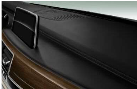
4ND_Кожаная отделка приборной панели

При выборе данной опции приборная панель отделяется эксклюзивной кожей "Nappa" высочайшего качества с контрастным швом.