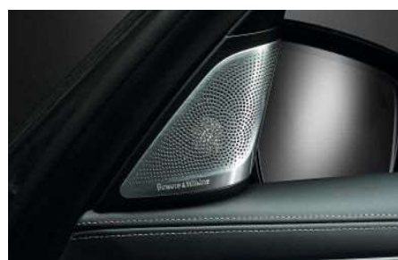
6F1_Аудиосистема Bowers & Wilkins Diamond Surround Sound

Аудиосистема Bowers & Wilkins Diamond Surround Sound с усилителем мощностью 1400 Вт, специально подобранным для автомобиля эквалайзером и 16 динамиками обеспечивает выдающееся студийное качество звука на всех местах в автомобиле.