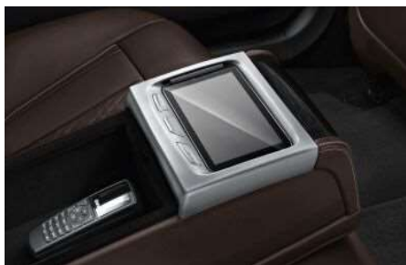
6U9_Сенсорный планшет BMW Touch Command

Сенсорный планшет BMW Touch Command с диагональю 7 дюймов встроен в подлокотник в задней части салона, объединен в единую сеть с системами автомобиля и предоставляет разнообразные возможности настройки и управления. В зависимости от установленного оборудования в автомобиле с планшета можно регулировать задние сиденья и сиденье переднего пассажира, настраивать климат-контроль, вентиляцию и обогрев задних сидений, а также освещение салона и комфортную подсветку, управлять шторкой панорамной крыши и шторками на окнах. Кроме того, возможно управление функциями развлекательной системы.