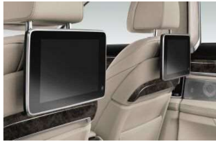
6FR_Развлекательная система для задних пассажиров Experience

Развлекательная система Experience в новом BMW 7-й серии предоставляет максимум возможностей пользователю. Центром всей системы является 7-дюймовый планшет Touch Command. Вы сможете просматривать любимые фильмы на двух 10-дюймовых дисплеях благодаря встроенному Blu-Ray плееру. Система поддерживает большое количество интерфейсов, таких как HDMI (для игровых консолей), Apple TV, MHL (для мобильных устройств), USB и многих других. При использовании Wi-Fi соединения Вы можете передавать изображение с любого Android смартфона или планшета на дисплеи системы.