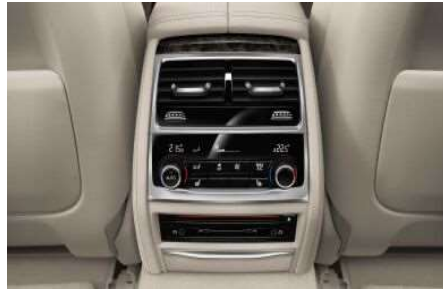
4NB_Автоматический климат-контроль, 4 зоны

Четырёхзонный климат-контроль обеспечивает возможность создания индивидуального микроклимата для водителя, переднего пассажира и пассажиров на заднем сиденье. Передний дисплей управления микроклиматом становится полностью сенсорным.