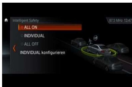
5AT_Ассистент вождения Plus

Система Ассистент вождения Plus включает в себя системы слежения за разметкой, предупреждения о столкновении и активный круиз-контроль с функцией Stop&Go, а также систему помощи при движении в пробках. Тем самым Driving Assistant Plus повышает безопасность и комфорт при движении на автобанах. Для использования системы Driving Assistant Plus и системы помощи при движении в пробках автомобиль должен быть оснащен АКПП и навигационной системой Professional.