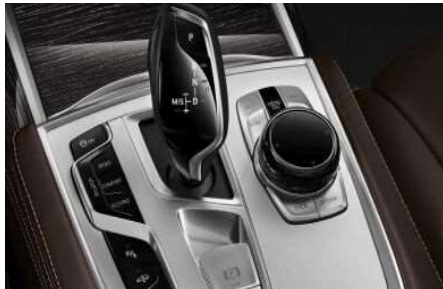
4U1_Керамическая отделка органов управления

Рычаг селектора коробки передач, элементы управления аудиосистемой, кондиционером, а также контроллер iDrive создаются из особой керамики, что дарит владельцу повышенный комфорт управления, а также ощущение эксклюзивности.