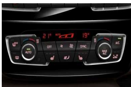
534_Климат контроль с расширенными функциями

В состав двухзонного климат-контроля входит система контроля загрязненности наружного воздуха (AUC) с фильтром из активированного угля, а также датчик запотевания и солнечный датчик.