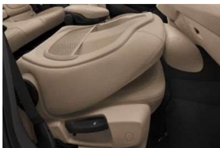
4FR_Откидная спинка сиденья переднего пассажира

Сиденье переднего пассажира со складной спинкой подчеркивает обширные возможности трансформации салона и продуманность его концепции.