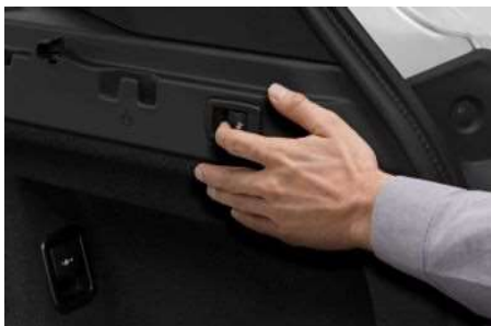
4FD_ Регулировка задних сидений

Задние сиденья, разделенные в соотношении 60:40, можно регулировать по отдельности. В зависимости от потребностей можно увеличить пространство для ног пассажиров или полезный объем багажника.