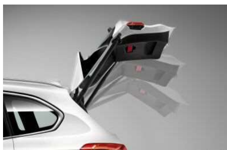
316_Автоматический привод крышки багажника

Автоматический привод крышки багажника избавит Вас от необходимости открывать и закрывать его вручную. Достаточно лишь нажать кнопку в салоне или в самом багажнике. Оборудован механизмом мягкого закрывания и системой звукового оповещения.