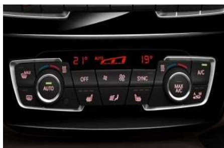
534_Климат контроль с расширенными функциями

В состав двухзонного климат-контроля входит система контроля загрязненности наружного воздуха (AUC) с фильтром из активированного угля, а также датчик запотевания и солнечный датчик.