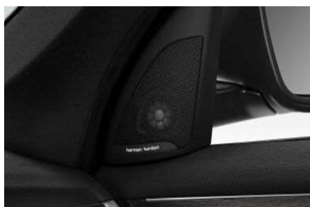
674_Звуковая система Harman Kardon

Эксклюзивная аудиосистема Harman/Kardon Surround Sound с цифровым усилителем мощностью 360 Вт, 7 каналами, специально настроенным эквалайзером и 12 динамиками подарит Вам неповторимое удовольствие от прослушивания любимой музыки с безупречным качеством звука.