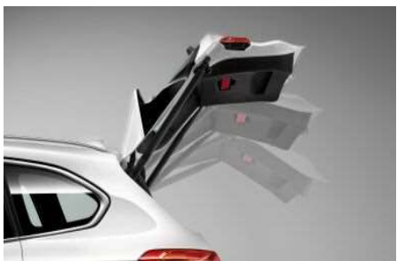
316_Автоматический привод крышки багажника

Автоматический привод крышки багажника избавит Вас от необходимости открывать и закрывать его вручную. Достаточно лишь нажать кнопку в салоне или в самом багажнике. Оборудован механизмом мягкого закрывания и системой звукового оповещения.