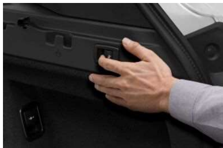
4FD_ Регулировка задних сидений

Задние сиденья, разделенные в соотношении 60:40, можно регулировать по отдельности. В зависимости от потребностей можно увеличить пространство для ног пассажиров или полезный объем багажника.