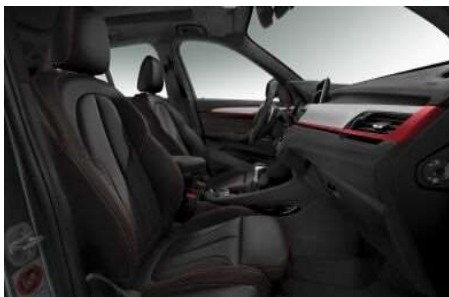
481_Спортивные сиденья для водителя и переднего пассажира

Спортивные сиденья для водителя и пассажира имеют улучшенную боковую и поясничную поддержку, а также расширенные возможности настройки их глубины и наклона. Это позволит Вам прочувствовать всю остроту и динамику Вашего BMW без потери привычного ощущения комфорта.