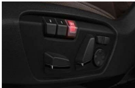
459_ Электрорегулировка кресел с памятью

Электрорегулировка сидений упрощает их настройку, а функция памяти позволяет запомнить наиболее удобное положение для сиденья и зеркал заднего вида.