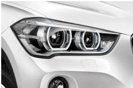
5A4_Фары LED с расширенным содержанием

Светодиодные фары дальнего и ближнего света с функцией освещения поворотов отличаются ярким светом, очень близким к дневному.