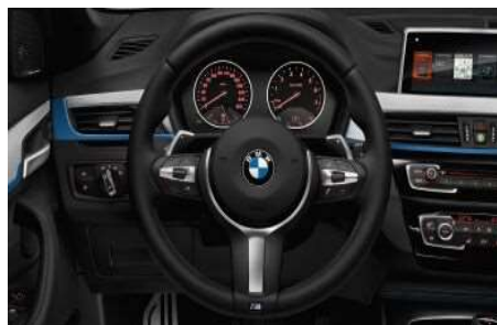
710_ Кожаное рулевое колесо M

Трехспицевое кожаное рулевое колесо M с мультимедийной функцией, ободом из черной кожи Walknappa и эргономичными упорами для больших пальцев