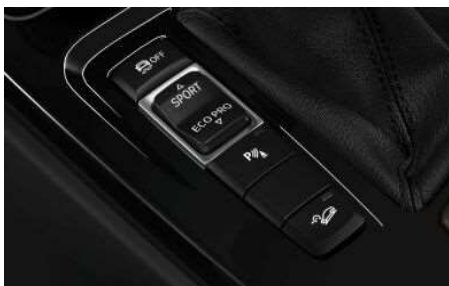
223_Dynamic Damper Control

Система позволяет адаптировать настройки амортизаторов к текущим условиям и повысить тем самым комфорт и динамику движения. Наряду со стандартной настройкой COMFORT, которая обеспечивает более высокий уровень комфорта, предлагается режим SPORT. В этом режиме амортизаторы становятся жестче, автомобиль становится "острее" в реакциях и приобретает более спортивные настройки