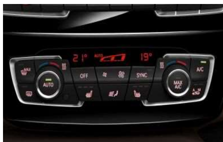
534_Климат контроль с расширенными функциями

В состав двухзонного климат-контроля входит система контроля загрязненности наружного воздуха (AUC) с фильтром из активированного угля, а также датчик запотевания и солнечный датчик.