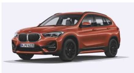
7AC_Пакет Sport Line