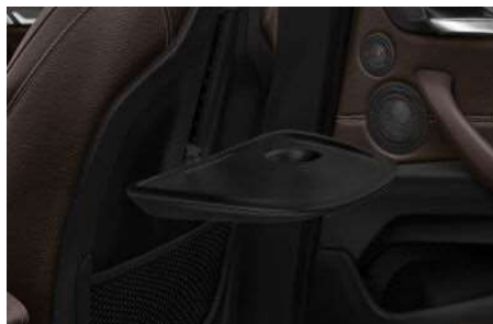
4UV_Задние откидные столики

Столики в задней части салона встроены в спинки передних сидений, они имеют достаточно большой размер и легко откидываются одним движением руки.