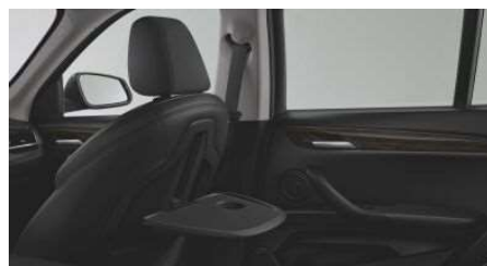
4UV_Задние откидные столики

Столики в задней части салона встроены в спинки передних сидений, они имеют достаточно большой размер и легко откидываются одним движением руки.