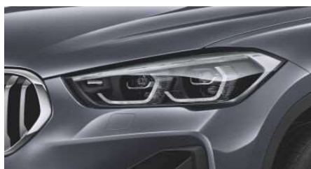
552_Адаптивные фары LED

Светодиодные фары дальнего и ближнего света с функцией освещения поворотов отличаются ярким светом, очень близким к дневному.