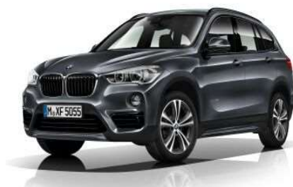
7AC_Пакет Sport Line