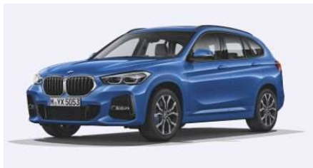
337_Пакет M Sport

(ниже показана лишь часть из всех доступных к заказу опций)