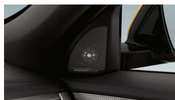
674_Аудиосистема Harman Kardon

Аудиосистема Harman Kardon с 12 динамиками оптимально адаптирована к акустическим особенностям интерьера, благодаря чему гарантируется исключительно высокое качество воспроизведения звука. Мощные сабвуферы, расположенные под передними сиденьями, образуют основу звука. Среднечастотные динамики, расположенные в каждой двери, дополнены высокочастотными динамиками, установленными в опорах наружных зеркал и задних дверях, обеспечивающими мощные высокие тона. Комбинация средне- и высокочастотных динамиков в передней панели вносит свой вклад в точность воспроизведения звука. Это означает, что на любом месте гарантируется выдающееся качество звука с объемным эффектом. Высокочастотные динамики с алюминиевыми ободками и надписью Harman/Kardon в основании наружных зеркал обеспечивают выдающееся качество звука. В багажнике находится 360-ваттный цифровой усилитель.