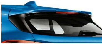
754_Задний спойлер M

Задний спойлер M подчеркивает спортивный вид автомобиля и делает акцент на задней части кузова с динамичными линиями. По сравнению со стандартным оборудованием, задний спойлер M имеет более выраженный изгиб в задней части и большие закрылки. Спойлер M не только делает облик автомобиля более спортивным, но и оптимизирует его аэродинамику, уменьшая подъемную силу на задней оси. На высоких скоростях, например, при движении по автомагистрали, он повышает курсовую устойчивость.