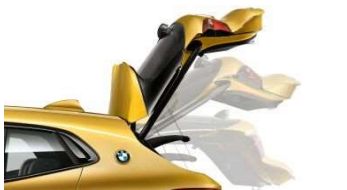
316_Автоматический привод крышки багажника

Автоматический привод крышки багажника позволяет дополнительно повысить удобство погрузки и разгрузки багажа. Крышку багажника BMW можно открыть или закрыть с помощью электропривода (нажав кнопку на ключе) или при помощи кнопки, расположенной в салоне автомобиля. Крышку багажного отделения можно открыть и обычным образом при помощи наружной ручки, а закрыть, нажав кнопку, расположенную на двери. Для предотвращения повреждения крышки багажника в помещениях с низким потолком (например, на подземной парковке) максимальная высота подъема может быть ограничена через меню iDrive. Встроенная защита от защемления и звуковое предупреждение обеспечивают дополнительную безопасность.