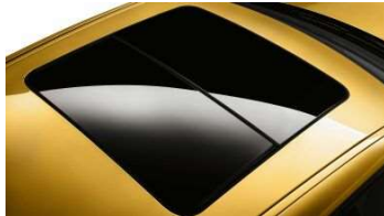
402_Панорамная стеклянная крыша

Панорамная стеклянная крыша обеспечивает хороший обзор и наполняет салон светом, создавая там ощущение особого пространства. Если солнце светит слишком ярко, можно легко и просто закрыть крышу солнцезащитной шторкой. Подъемно-сдвижная функция крышки люка стеклянной панорамной крыши обеспечивает широкие возможности дополнительной вентиляции. Если передняя часть крышки поставлена в положение вентиляции, то солнцезащитная шторка автоматически отодвигается назад, чтобы не мешать потоку воздуха. Интегрированный ветроотражатель активируется автоматически, чтобы свести к минимуму завихрения воздуха при движении с открытым люком.