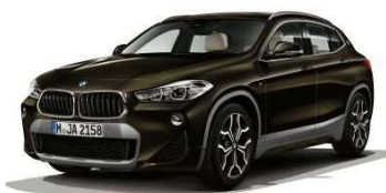
33A_Пакет M Sport X