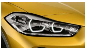
5A4_Фары LED с расширенным содержанием

Светодиодные фары с функцией освещения поворотов ярко и точно освещают дорогу, чтобы движение в темноте было более безопасным и менее утомительным. При включении ближнего и дальнего света фары генерируют яркий свет с комфортным спектром, близким к спектру естественного освещения. Функции динамического и статического освещения поворотов реализованы также на основе светодиодных технологий. Благодаря функции адаптивного освещения поворотов светом низкой яркости лучше освещаются обочины городских улиц на скорости до 50 км/ч или при торможении со скоростью ниже 40 км/ч, поэтому водитель может раньше распознавать пешеходов или велосипедистов. В диапазоне 40–70 км/ч функция адаптивного освещения поворотов действует как статическая функция. А при движении по автомагистралям водитель может также получать преимущества от адаптивного освещения. При движении со скоростью выше 110 км/ч в течение более 30 секунд или при движении со скоростью выше 140 км/ч лучи ближнего света автоматически удлиняются. При достижении скорости ниже 80 км/ч режим освещения для автомагистрали автоматически отключается. Двойные кольца дневных светодиодных ходовых огней, расположенных внутри блок-фар, создают яркий и безошибочно узнаваемый облик BMW. Для указателей поворотов также используются экономичные и долговечные светодиоды.