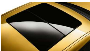
402_Панорамная стеклянная крыша

Панорамная стеклянная крыша обеспечивает хороший обзор и наполняет салон светом, создавая там ощущение особого пространства. Если солнце светит слишком ярко, можно легко и просто закрыть крышу солнцезащитной шторкой. Подъемно-сдвижная функция крышки люка стеклянной панорамной крыши обеспечивает широкие возможности дополнительной вентиляции. Если передняя часть крышки поставлена в положение вентиляции, то солнцезащитная шторка автоматически отодвигается назад, чтобы не мешать потоку воздуха. Интегрированный ветроотражатель активируется автоматически, чтобы свести к минимуму завихрения воздуха при движении с открытым люком.