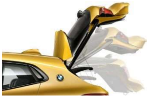
316_Автоматический привод крышки багажника

Автоматический привод крышки багажника позволяет дополнительно повысить удобство погрузки и разгрузки багажа. Крышку багажника BMW можно открыть или закрыть с помощью электропривода (нажав кнопку на ключе) или при помощи кнопки, расположенной в салоне автомобиля. Крышку багажного отделения можно открыть и обычным образом при помощи наружной ручки, а закрыть, нажав кнопку, расположенную на двери. Для предотвращения повреждения крышки багажника в помещениях с низким потолком (например, на подземной парковке) максимальная высота подъема может быть ограничена через меню iDrive. Встроенная защита от защемления и звуковое предупреждение обеспечивают дополнительную безопасность.