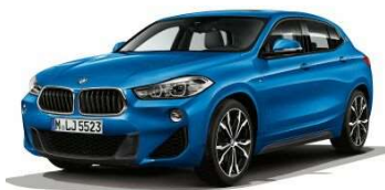
337_Пакет M Sport

(ниже показана лишь часть из всех доступных к заказу опций)