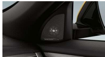
674_Аудиосистема Harman Kardon

Аудиосистема Harman Kardon с 12 динамиками оптимально адаптирована к акустическим особенностям интерьера, благодаря чему гарантируется исключительно высокое качество воспроизведения звука. Мощные сабвуферы, расположенные под передними сиденьями, образуют основу звука. Среднечастотные динамики, расположенные в каждой двери, дополнены высокочастотными динамиками, установленными в опорах наружных зеркал и задних дверях, обеспечивающими мощные высокие тона. Комбинация средне- и высокочастотных динамиков в передней панели вносит свой вклад в точность воспроизведения звука. Это означает, что на любом месте гарантируется выдающееся качество звука с объемным эффектом. Высокочастотные динамики с алюминиевыми ободками и надписью Harman/Kardon в основании наружных зеркал обеспечивают выдающееся качество звука. В багажнике находится 360-ваттный цифровой усилитель.