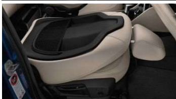
4FK_Спинка кресла переднего пассажира с функцией полного складывания вперед

Сиденье переднего пассажира со складываемой спинкой повышает гибкость при перевозке длинных предметов. Спинку сиденья можно полностью откинуть вперед – при этом образуется практически горизонтальная поверхность. Это позволяет перевозить длинные предметы и спортивное оборудование.