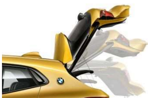
316_Автоматический привод крышки багажника

Автоматический привод крышки багажника позволяет дополнительно повысить удобство погрузки и разгрузки багажа. Крышку багажника BMW можно открыть или закрыть с помощью электропривода (нажав кнопку на ключе) или при помощи кнопки, расположенной в салоне автомобиля. Крышку багажного отделения можно открыть и обычным образом при помощи наружной ручки, а закрыть, нажав кнопку, расположенную на двери. Для предотвращения повреждения крышки багажника в помещениях с низким потолком (например, на подземной парковке) максимальная высота подъема может быть ограничена через меню iDrive. Встроенная защита от защемления и звуковое предупреждение обеспечивают дополнительную безопасность.