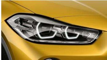
5A4_Фары LED с расширенным содержанием

Светодиодные фары с функцией освещения поворотов ярко и точно освещают дорогу, чтобы движение в темноте было более безопасным и менее утомительным. При включении ближнего и дальнего света фары генерируют яркий свет с комфортным спектром, близким к спектру естественного освещения. Функции динамического и статического освещения поворотов реализованы также на основе светодиодных технологий. Благодаря функции адаптивного освещения поворотов светом низкой яркости лучше освещаются обочины городских улиц на скорости до 50 км/ч или при торможении со скоростью ниже 40 км/ч, поэтому водитель может раньше распознавать пешеходов или велосипедистов. В диапазоне 40–70 км/ч функция адаптивного освещения поворотов действует как статическая функция. А при движении по автомагистралям водитель может также получать преимущества от адаптивного освещения. При движении со скоростью выше 110 км/ч в течение более 30 секунд или при движении со скоростью выше 140 км/ч лучи ближнего света автоматически удлиняются. При достижении скорости ниже 80 км/ч режим освещения для автомагистрали автоматически отключается. Двойные кольца дневных светодиодных ходовых огней, расположенных внутри блок-фар, создают яркий и безошибочно узнаваемый облик BMW. Для указателей поворотов также используются экономичные и долговечные светодиоды.