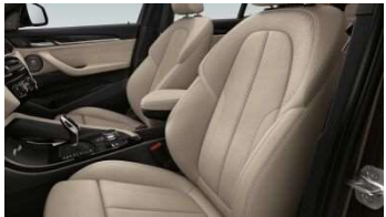
481_Спортивные передние кресла

Отличная поддержка и оптимальная эргономика: регулируемые спортивные сиденья водителя и переднего пассажира имеют дополнительные регулировки по сравнению с обычными сиденьями. Наряду с большей высотой спинок и валиками боковой поддержки, обеспечивающими надежную опору при активном прохождении поворотов, можно регулировать угол наклона и глубину сиденья, а также положение опоры для бедра в соответствии с особенностями фигуры и для достижения желаемых характеристик. С помощью электропривода можно регулировать даже положение подлокотника. Высококачественные материалы отделки, осязаемая боковая поддержка и тщательно выверенная эргономика спортивных сидений гарантируют непревзойденный комфорт.