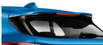
754_Задний спойлер M

Задний спойлер M подчеркивает спортивный вид автомобиля и делает акцент на задней части кузова с динамичными линиями. По сравнению со стандартным оборудованием, задний спойлер M имеет более выраженный изгиб в задней части и большие закрылки. Спойлер M не только делает облик автомобиля более спортивным, но и оптимизирует его аэродинамику, уменьшая подъемную силу на задней оси. На высоких скоростях, например, при движении по автомагистрали, он повышает курсовую устойчивость.