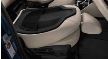
4FK_Спинка кресла переднего пассажира с функцией полного складывания вперед

Сиденье переднего пассажира со складываемой спинкой повышает гибкость при перевозке длинных предметов. Спинку сиденья можно полностью откинуть вперед – при этом образуется практически горизонтальная поверхность. Это позволяет перевозить длинные предметы и спортивное оборудование.