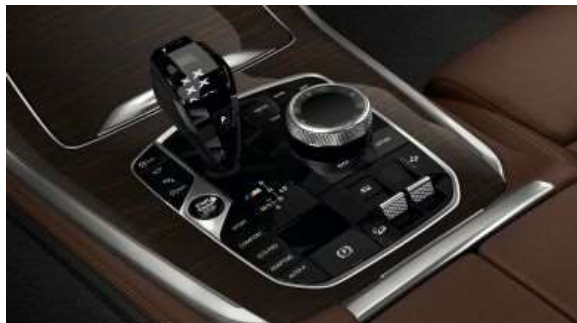
4A2_Отделка стеклом 'CraftedClarity'