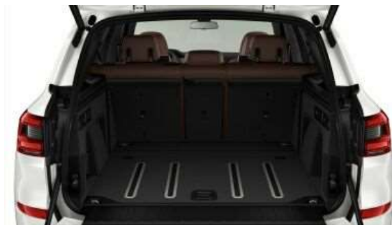
Пакет багажного отсека