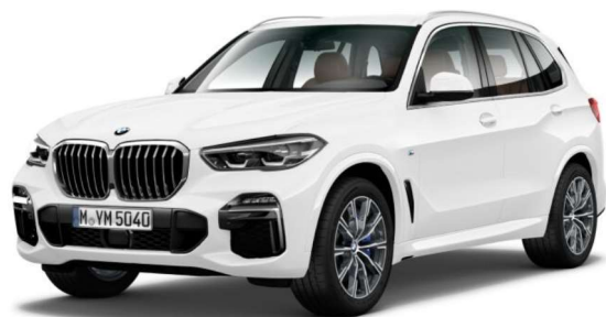
337_Пакет M Sport