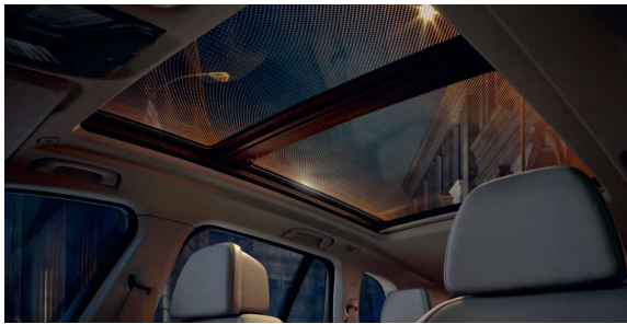
407_Панорамная крыша Sky Lounge

Панорамная стеклянная крыша Sky Lounge позволяет создать днем ощущение большего пространства в салоне, а ночью - стильную атмосферу, благодаря световой графике, состоящей из более чем 15 000 светодиодных элементов и использующей любой из 6 цветов комфортной подсветки салона.