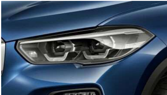
552_Адаптивные фары LED

Объединяют в себе неослепляющую систему управления дальним светом фар BMW Selective Beam, систему статического освещения поворотов и адаптивные фары головного света.