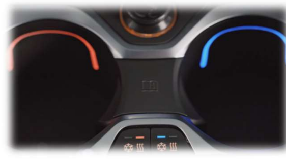
442_Подстаканники на центральной консоли с охлаждением и подогревом

Визуализация температуры цветом (синий/красный)