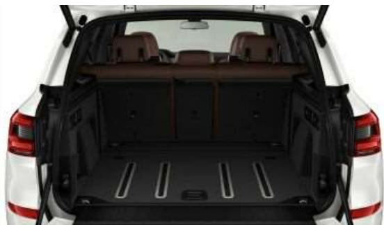
Пакет багажного отсека