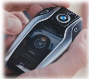
2VR_Адаптивная пневмо-подвеска с автоуровнем

>лифт вручную до 30 км/ч на 40 мм (30 км/ч - 55 км/ч на 20 мм) >автоматическое занижение свыше 140 км/ч на 10 мм (свыше 200 км/ч на 20 мм) >5 уровней высоты с максимальным ходом до 80 мм >при наличии опции 3DS 'Интерактивный ключ BMW display key' возможна регулировка высоты а/м снаружи >для погрузки а/м занижается кнопкой в багажном отсеке