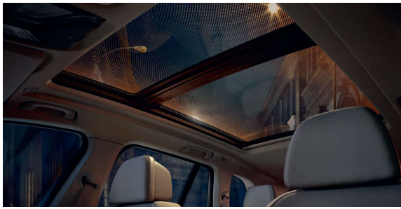
407_Панорамная крыша Sky Lounge

Панорамная стеклянная крыша Sky Lounge позволяет создать днем ощущение большего пространства в салоне, а ночью - стильную атмосферу, благодаря световой графике, состоящей из более чем 15 000 светодиодных элементов и использующей любой из 6 цветов комфортной подсветки салона.