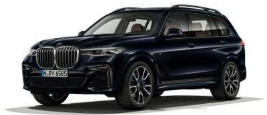
337_Пакет M Sport

Пакет M Sport наделяет автомобиль еще более спортивным характером. Помимо проработанного дизайна внешнего вида благодаря многочисленным деталям экстерьера (например, элементы цвета "Черный Хром") и интерьера (например, отделка потолка алькантарой BMW Individual цвета "Антрацит") пакет M Sport также гарантирует дополнительное удовольствие от вождения. Спортивная АКПП Steptronic, тормоза M Sport и аэродинамический пакет M значительно улучшают динамические характеристики автомобиля.