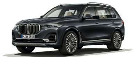
7LY_Пакет дизайна Pure Excellence

Дизайн Pure Excellence создает яркие акценты. Хромированные элементы отделки экстерьера и оригинальные элементы дизайна интерьера благодаря уникальному мастерству изготовления подчеркивают современный, роскошный и изысканный характер BMW X7.