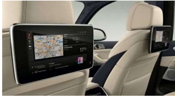
6FH_Система развлечения для задних пассажиров Professional

Развлекательная система для задних пассажиров Professional, в которую входят два отдельных цветных сенсорных экрана высокой четкости, не даст пассажирам скучать. Дополнительный привод Blu-ray в задней части салона позволяет пассажирам смотреть различные фильмы на каждом из двух 10.2" мониторов с высоким разрешением. Система обеспечивает доступ к развлекательным функциям автомобиля. Имеется возможность смотреть телевизор, пользоваться онлайн-функциями или подключать MP3-плееры, игровые консоли и многое другое. Звук идет через динамики или наушники. Пассажиры в задней части салона имеют также доступ к функциям навигационной системы независимо от водителя. Оба монитора имеют отделку цвета "Глянцевый Черный". Кроме того, в систему входят цифровой разъем HDMI и USB-порт для зарядки внешних устройств.